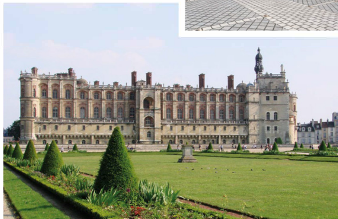
Château de Saint-Germain-en-Laye